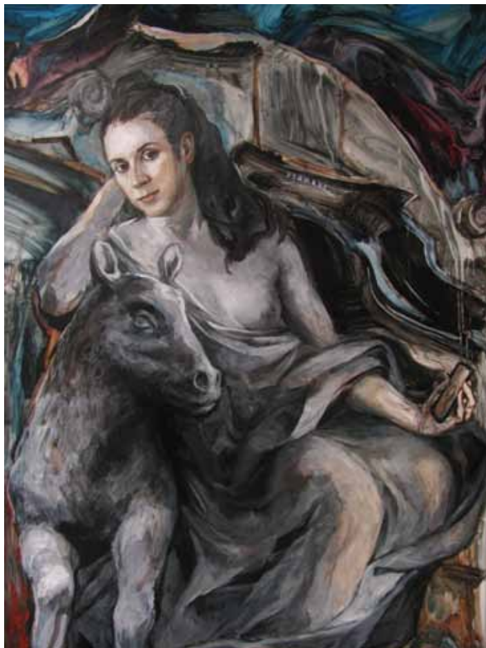
Lenost - Selfie