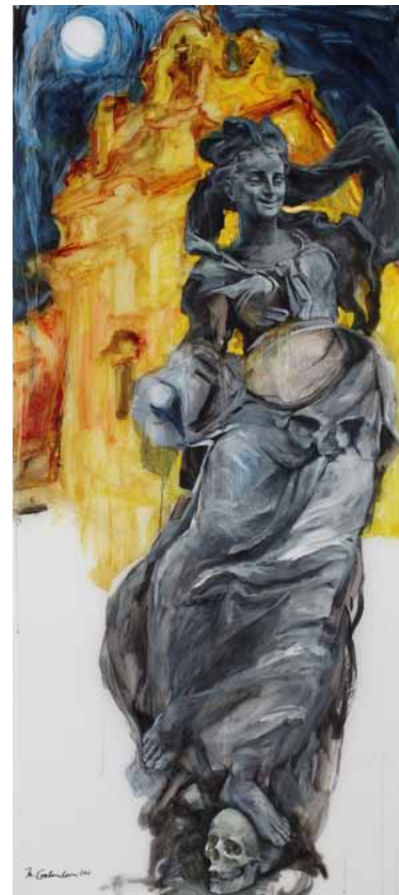
Lehkomyšlnost se mění v Naději