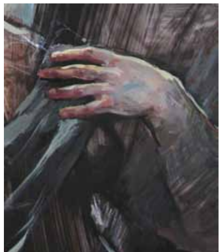
Upřímnost (detail 2)