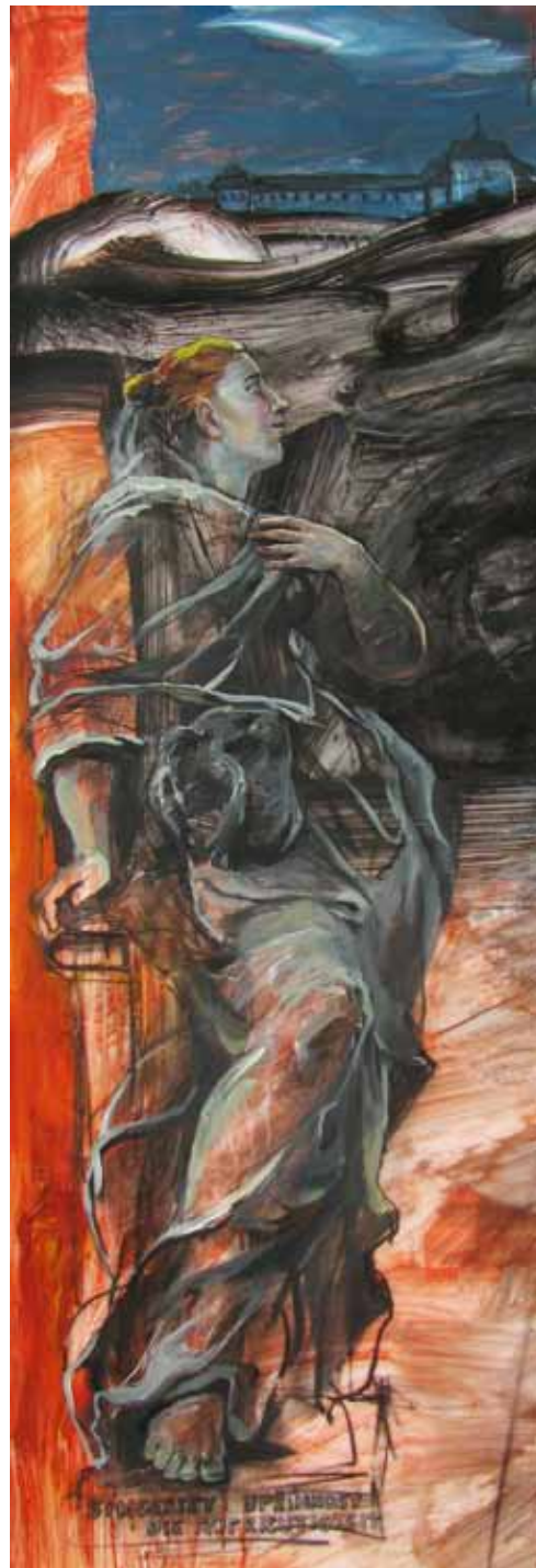
Upřímnost (detail 1)

V letech 1990-2015 působila na Ontario College of Art and Design University v Torontu, kde vyučovala figurální kresbu a malbu. Součástí její tvorby jsou portréty významných osobností kulturního a společenského života.